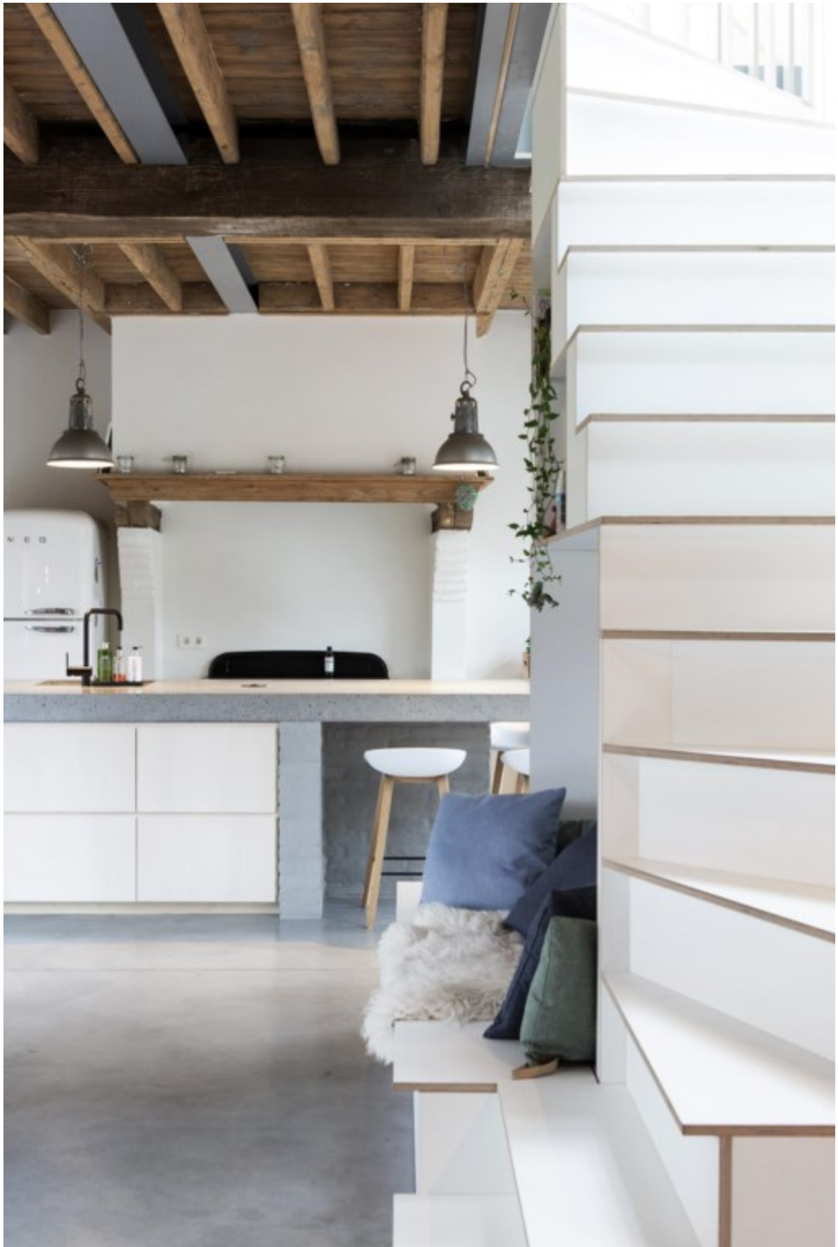
De trap, of was het een kast met zitbankje?