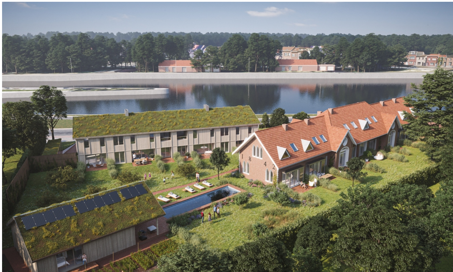
Impressie van hoe de Molenhoeve na restauratie en herinrichting en uitbreiding door HEEM zal verrijzen als cohousingproject Kadans.

"In een nieuwe laagbouw, zoals het hele project getekend door B-architecten, komen zes woningen. De gerenoveerde Molenhoeve biedt plaats genoeg voor acht woningen, allemaal met terras en privétuin. De bewoners van Kadans zullen naast hun eigen woning en privétuin samen kunnen genieten van een zwembad, sauna en grote groene buitenruimte. Bovendien is er een gemeenschappelijke binnenruimte die gebruikt kan worden als thuiswerkplek, voor een etentje of als gemeenschappelijke bibliotheek. De be-