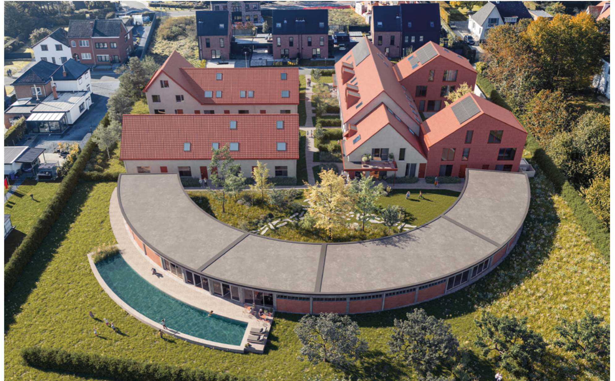
De boog is de originele eyecatcher van dit project