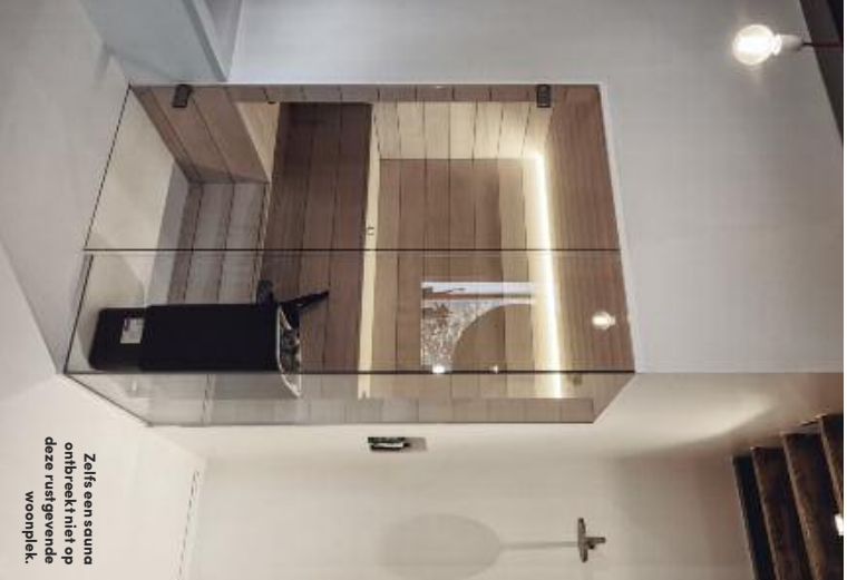
Zelfs een sauna ontbreekt niet op deze uitsgevend woonplek.