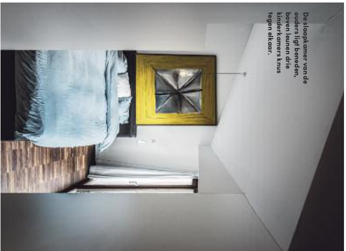
De slaapkamer van de ouders ligt beneden, boven leunen drie kinderkamers knus tegen elkaar.