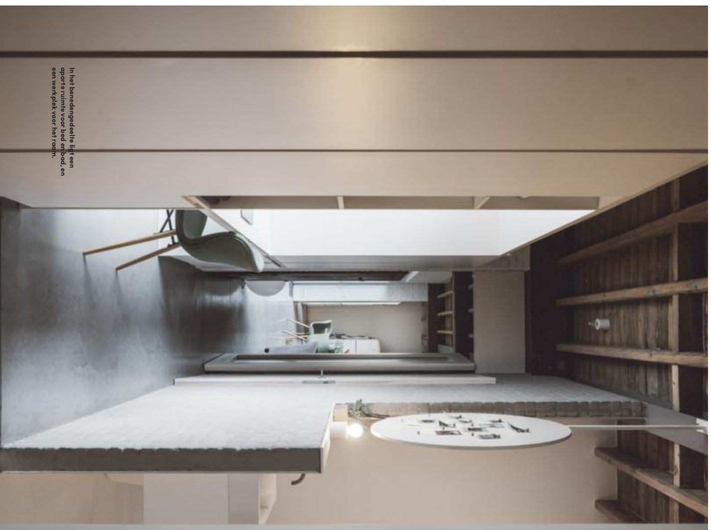
In het benedengedeelte ligt een aparte ruimte voor bed, enbad, en een werkplek voor het raam.

De buitenkant hebben we zoveel mogelijk bewaard. Om die uniformiteit te garanderen leverden we alle woningen semi-casco op. Zo konden we waken over de ramen, het schrijnwerk, de kadei en de daken, en enkele duurzame technieken invoeren waar we veel belang aan hechten. Denk maar aan geothermie, een wacterpui, warmtepompssystemen, regenwaterrecuperatie en vloerverwarming. Daarna kon iedereen in zee met zijn eigen architect, maar alle bewoners kozen vrijwillig voor dezelfde. Elk huis is anders, maar je herkent die ene handtekening overal." ►