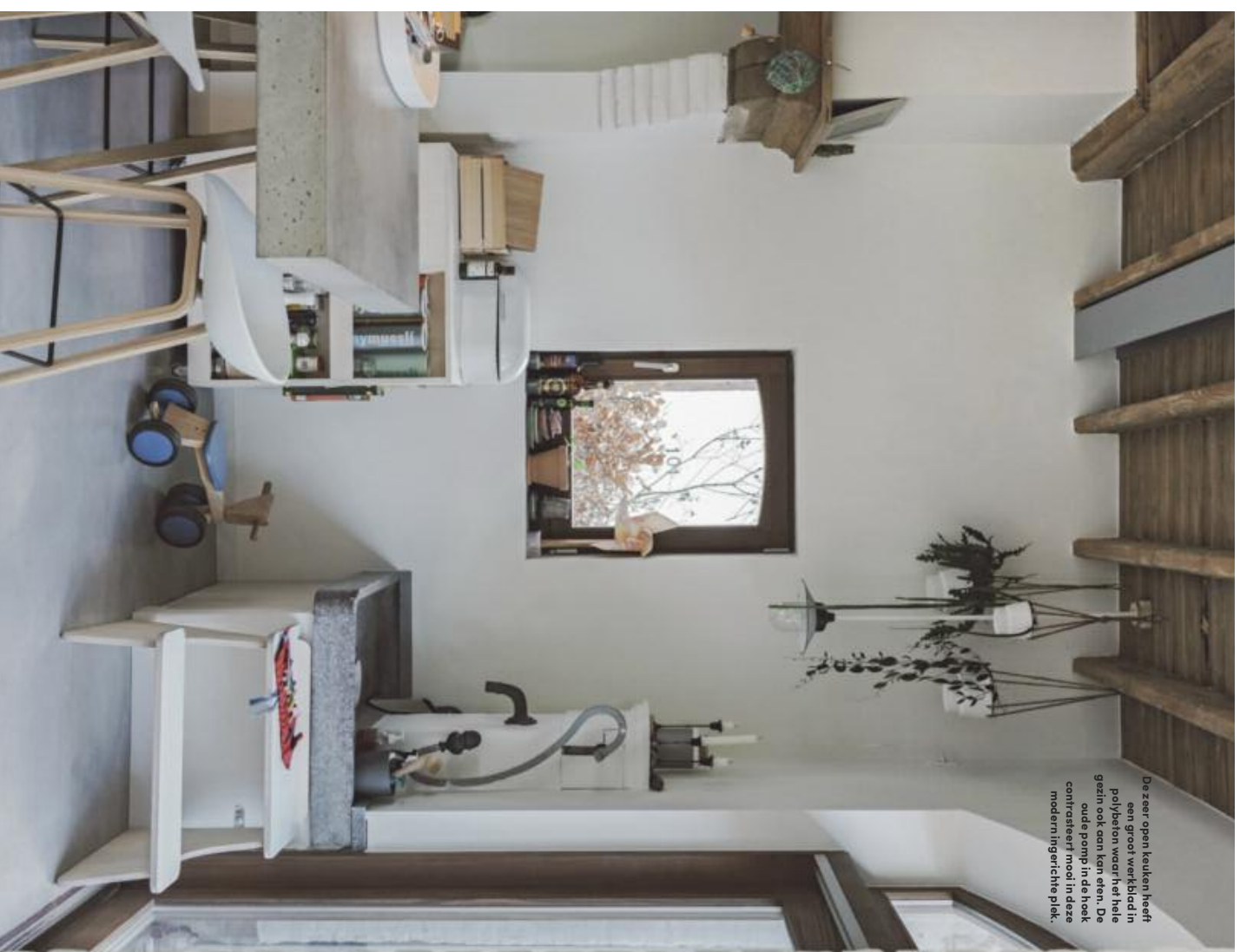
De zeer open keuken heeft een groot werkblad in polyëten, waar het hele gezin ook aan kan eten. De oude pomp in de hoek contrasteert mooi in deze modern ingerichte plek.